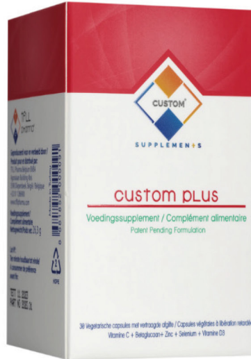
Custom Plus® Vitamin C + Betaglukan + Çinko + Selenyum + Vitamin D3 Takviye Edici Gıda Takviye Edici Gıda Onay Numarası: 009011-12.11.2020