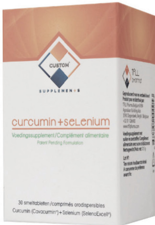
Custom® Kurkumin + Selenyum İçeren Takviye Edici Gıda Takviye Edici Gıda Onay Numarası: 004741-09.10.2018