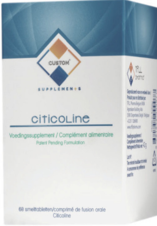
Custom® Sitikolin İçeren Takviye Edici Gıda Takviye Edici Gıda Onay Numarası: 007365-16.03.2020