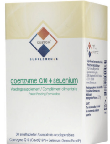
Custom® Koenzim Q10 + Selenyum İçeren Takviye Edici Gıda Takviye Edici Gıda Onay Numarası: 007535-13.04.2020