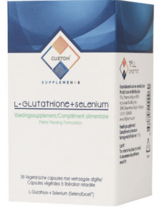
Custom® Glutasyon + Selenyum İçeren Takviye Edici Gıda Takviye Edici Gıda Onay Numarası: 004752-12.10.2018